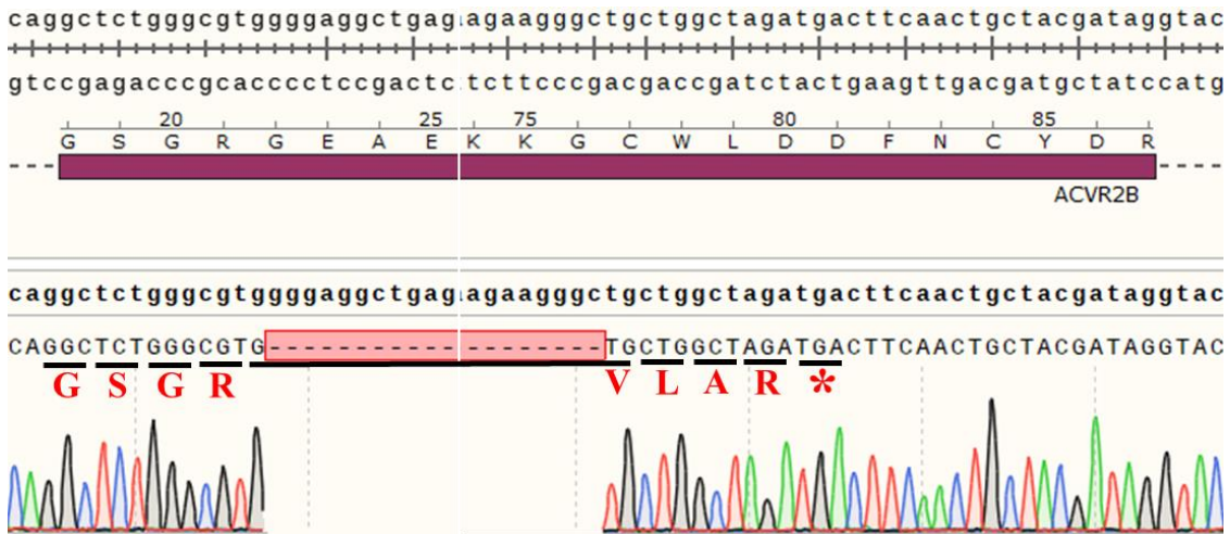
Fig 1. Sanger 测序验证敲除效果